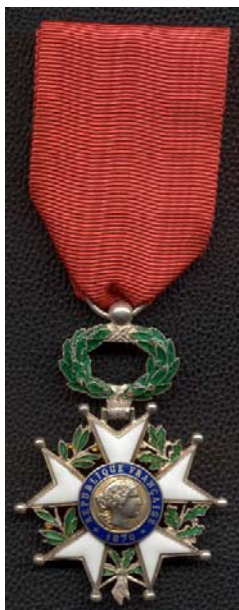
Орденот легија на честа Legion of Honour

За време на француската револуција со декрет од 30.07.1791 се укинали сите претходни одликувања во Франција. На предлог на Наполеон Бонапарта во 1802 год-