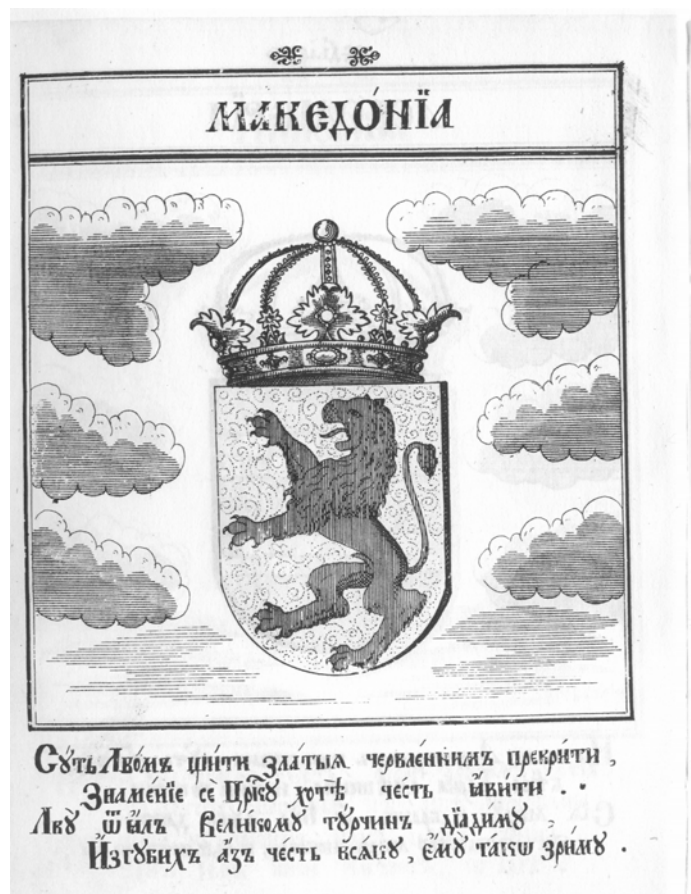
Грбот на Македонија Coat of Arms of Macedonia

лемо хералдичко значење, бидејќи од нејзината појава па сè до денес, таа била основен извор за хералдичките потреби кај сите јужните Словени таа служела за примена на хералдиката во практика. Кога се поставувало прашањето за државен грб, сите јужни Словени, без исклучок, се обратиле кон Стематомографијата на Жефарович. Така, по ослободувањето во 1879 година Бугарија за државен грб го прогласила - жолтиот лав со круна на темноцрвено поле, а над полето царска круна, земен од Стематомографијата на Жефарович, без никакви измени. Слично направиле и Хрватска, Црна Гора, а и Кралството СХС во 1921 година. Македонија по ослободувањето прогласи свој грб, но поради задоцнувањето и незнаење не се угледа на Стематомографијата , како што бил случајот со другите јужнословенски народи 2 . Кај Жефарович македонскиот грб го има трипати, и тоа еднаш посебно, а двапати заедно со другите словенски грбови. Посебниот грб е претстава на