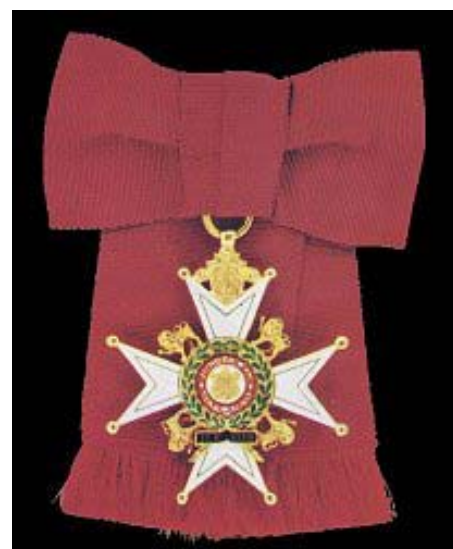
Дама командир на Орденот на бањата Order of Bath dame commander

During the French revolution with decree of 30.07.1791 all orders and medals from imperial France were banned. On suggestion of Napoleon Bonaparte in 1802, the order of the Legion of Honor was establish, which with some changes in the type of the