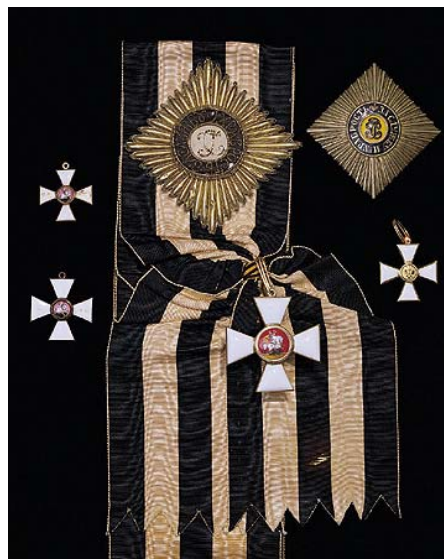
Орденот на Свети Ѓорѓи Order of Saint George

Интересно е да се спомене дека одредени земји (Естонија, Латвија, В.Британија, Австралија...) имаат посебна форма на одликувања кои се доделуваат на господа, а посебна форма за дами. Дамската верзија на одликувањето секогаш е во форма на панделка на која е прикачен бецот на орденот, а пак доколку одликувањето се доделува со лента, лентата за дамите е со помала широчина од онаа за господата.