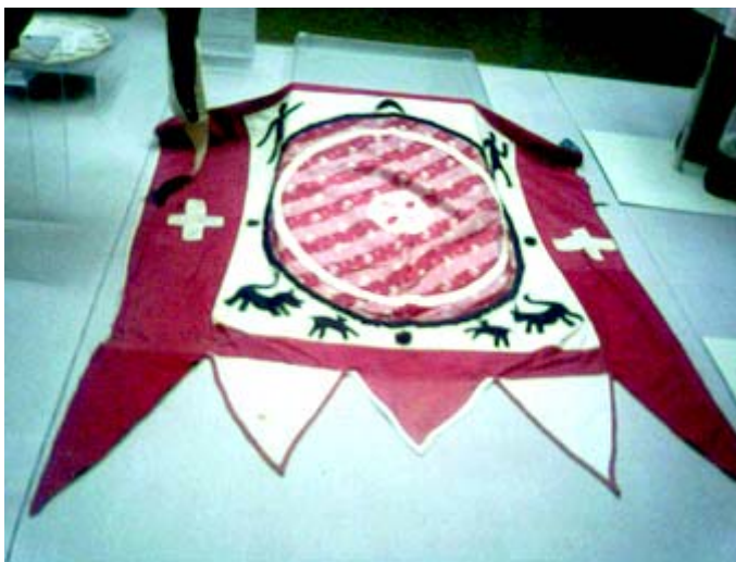
Музеј на Македонија- етнологска збирка Museum of Macedonia-ethnology display

лав по паѓањето на Бугарија под Турско владеење во 1395 г. е зачувано во дебарскиот крај. 12 Исто такво знаме со лав се употребува во реканскиот крај кај Мијаците, објаснува Трајчев. И го опишува вака: на бело платно од копрена или друг материјал, долго околу 1 м. кое служи како главно поле, во средината е претставен крст со круг на пресекот на краците, а во празниот простор меѓу краците е испишано со познатите кратенки името на Исус Христус ИС ХС и НИКА (Победа). Во четирите агли стојат мали фигури на лав, двоглав орел без крила, змеј и полумесечина со ѕвезда над него. Работите се обработени со црвени триаголници кои ги гледаме и на