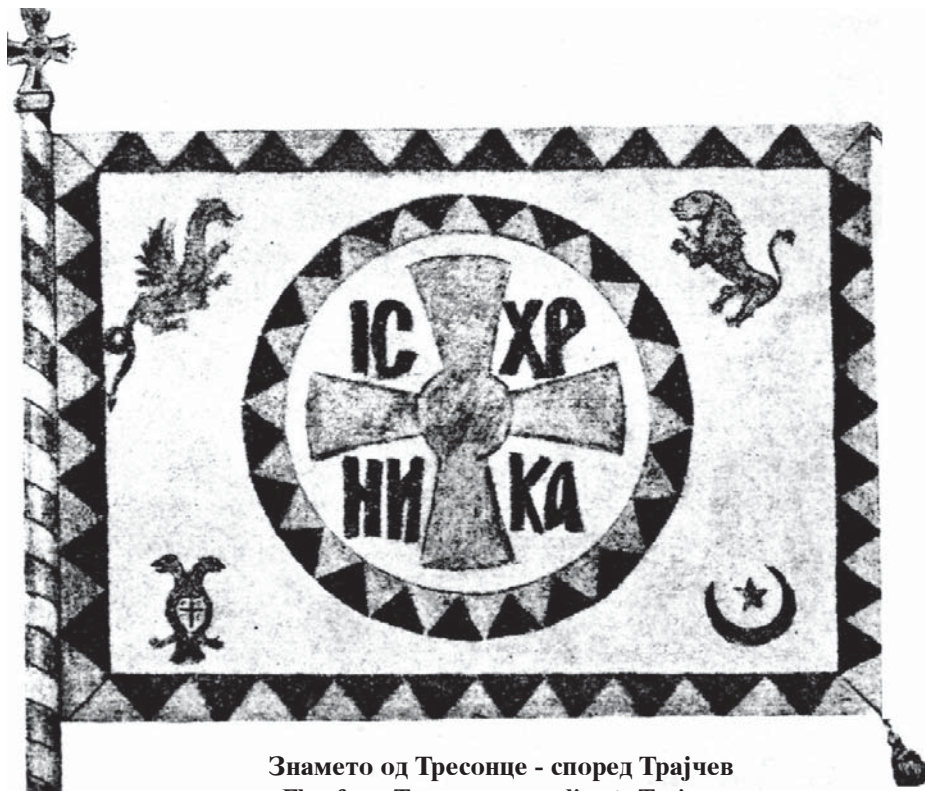
Знамето од Тресонце - според Трајчев Flag from Tresonce, according to Trajcev

Бидејќи овие две знамиња особено се разликуваат од оние две опишани погоре, од кои барем едното е старо над 200 години, можеби овде имаме помлади варијанти или ова се само свадбарски варијанти работени во децениите по втората светска војна, кога Мијачијата почнала да опустува, па веќе не било толку важно да се употреби оригинално знаме туку можеби почнале да се изработуваат негови деривати од страна на оние фамилии кои дотогаш не го поседувале? Индикативно е и не постоењето на