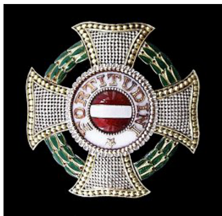
Орден Марија Тереза Order Maria Teresa

badges of the orders are worn at sash, collar or as a breast star.