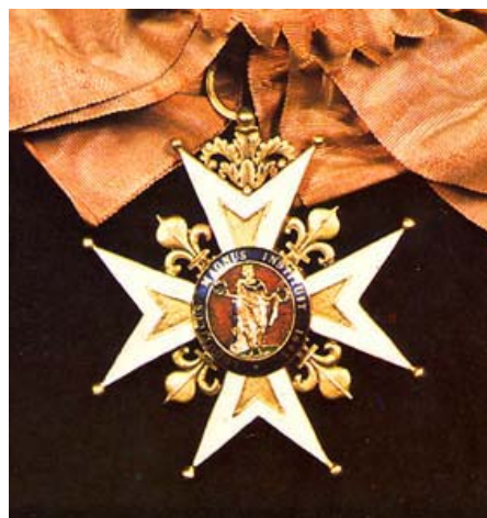
Орденот на Свети Луј Ordre de Saint Louis

ина востановен е Орден Легија на честа, кој во нешто поизменет облик и до денешен ден остана највисоко француско цивилно и воено одликување.